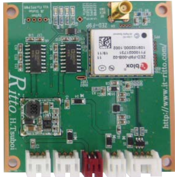
Multi GNSS Receiver