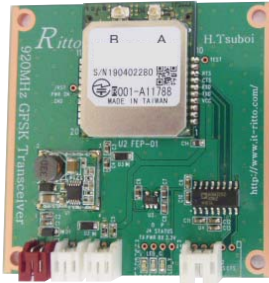
920MHz Wireless Radio